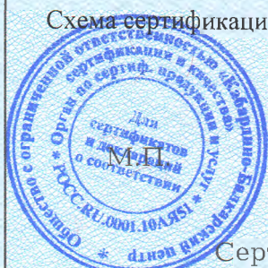
Схема сертификации № 1с.